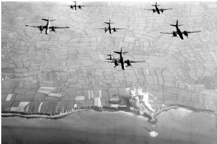
Luftangriff auf die Küstenbatterien der Artillerie in Pointe-du-Oc, am Morgen des 6. Juni 1944

George: In der ersten Juniwoche waren wir in Alarmbereitschaft, aber Witt teilte uns mit, dass die Wetterberichte die Invasion zu diesem Zeitpunkt verhindern könnten, obwohl unsere Jungs bereit waren. Ich war sehr gespannt, denn jeden Tag gab es Luftangriffe: Bahnhöfe, Brücken, Straßen und