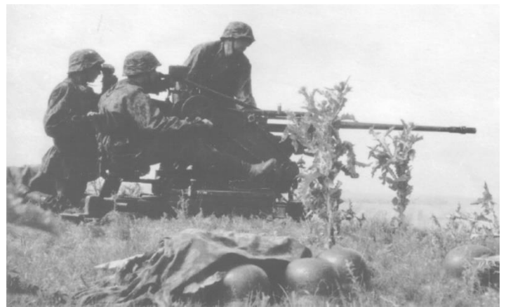
Eine Trainingsübung, bei der eine Hitlerjugend-Besatzung ihre 20-mm-FlaK 30 in einer bodengestützten Rolle einsetzt. Eine typische fünfköpfige Besatzung bestand aus dem Geschützführer, dem Richtschützen, dem Entfernungseinsteller, dem Lader und dem Entfernungsmesserbediener. 1943 verfügte die Hitlerjugend nur über wenige FlaK, PaK oder Artilleriegeschütze. Den ganzen Sommer 1943 über setzte die SS-Hitlerjugend-Division ihre militärische Ausbildung in Belgien fort. Obwohl es an Uniformen mangelte, waren die psychologischen Aussichten der Jungen gut. Sie hatten schnell ein Gefühl der Zugehörigkeit und des Stolzes auf die Einheit entwickelt. Dies war eine wichtige Voraussetzung für jede Kampftruppe, die auf dem Schlachtfeld bestehen sollte.

Das Panzerregiment erhielt gute Panzer und sogar einige Panther kamen zu uns. Aber nach den Erfahrungen bei Kursk waren wir skeptisch, sie im Kampf zu sehen; aber die Ingenieure versicherten uns, dass die Kinderkrankheiten behoben waren. Die Division wuchs wirklich zusammen, so dass wir im März 44 voll einsatzbereit waren und uns den Alliierten stellen wollten. Jeder hatte Vermutungen darüber, wo die Alliierten landen würden. Ich möchte Ihnen sagen, dass die belgische Bevölkerung sehr freundlich zu uns war. Ein Beispiel dafür war, dass das Motorrad eines Einsatzfahrers eine Panne hatte und ein Bauer lud sie und ihr Motorrad auf seinen Wagen und brachte sie zu uns, mit vollen Bäumen. Meyer stellte sicher, dass er für sein Benzin und seine Zeit bezahlt wurde.