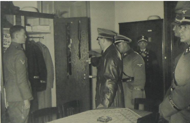
Adolf Hitler inspiziert einen Spind während eines Besuchs bei seiner SS-Leibstandarte. Ebenfalls abgebildet ist SS-Obergruppenführer Josef (Sepp) Dietrich (hinter Hitler stehend).

Sind Sie Hitler jemals begegnet, seit Sie in der LAH waren?