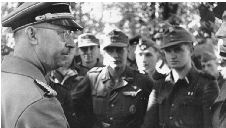
Reichsführer-SS Heinrich Himmler inspiziert die Rekruten der neuen Division in der Kaiserslautern-Kaserne im Mai 1943. Die neue Division wurde um einen Kern erfahrener Offiziere und Unteroffiziere gebildet, die von der SS-Panzer-Grenadier-Division "Liebstandarte Adolf Hitler" übernommen wurden. Diese Männer sollten die Hitlerjugend zu einer schlagkräftigen Kampfeinheit formen.

Es fiel einigen jedoch schwer, ihren Zorn zu zügeln, denn manchmal bezahlten die Schuldigen, insbesondere die politischen Offiziere, mit ihrem Leben, wenn sie erwischt wurden. Besonders grausam gingen sie mit der Zivilbevölkerung in den zurückeroberten Gebieten um; es schien, dass jeder, der mit uns befreundet war, getötet wurde, auch das habe ich aus erster Hand erfahren. Ich möchte hinzufügen, dass wir sehr freundlich mit der russischen Bevölkerung umgingen, sie gaben uns Essen, Unterkunft und viele Männer hatten russische Freundinnen, obwohl uns gesagt wurde, dass wir keinen Sex haben sollten, da dies den Eindruck erwecken könnte, dass wir die Frauen ausnutzen, hielten sich viele nicht daran, da sie russische Frauen attraktiv fanden.