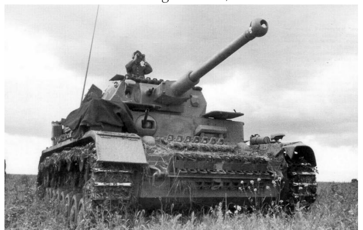
Panzerkampfwagen IV (PzKpfw IV) Ausführung F2 Russische Front - 1942

Ein Problem, das alle Panzereinheiten hatten war, dass diese Maschinen wirklich Maschinen waren und oft ausfielen. Manchmal zum denkbar ungünstigsten Zeitpunkt. Ich habe das oft erlebt und unsere Bergungsmannschaften waren immer wieder die Helden der Einheit. Ich trug gerne den schwarzen Mantel, denn wenn ich bei