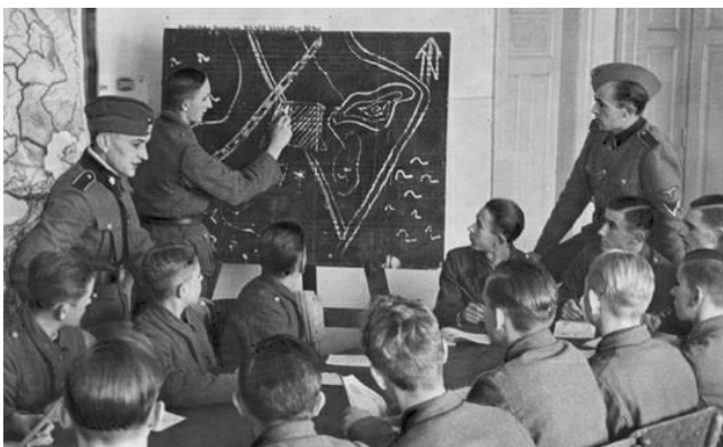
SS-Rekruten studieren vor einer militärischen Übung eine Karte in einer der Ausbildungsbaracken. Den SS-Rekruten wurde beigebracht, dass die "einzige Form der Verteidigung auf dem Schlachtfeld der Angriff ist". Die SS glaubte fest an die Schule "hart trainieren, leicht kämpfen". Die Ausbildung machte den durchschnittlichen SS-Mann bereit, sein Leben zum Wohle des Volkes zu riskieren.

Wir führten zwar politische Diskussionen, aber eher um etwas über das Weltgeschehen zu erfahren und zwar in einem informellen Rahmen. Manchmal wurden wir von unseren Führern in einen Schulungsraum geholt, um Gesetzesänderungen und die staatliche Politik zu besprechen. Natürlich wurde von uns erwartet, dass wir "Mein Kampf" lesen, damit wir die Ursachen unserer NS-Revolution gut verstehen konnten. Viele von uns hatten es bereits