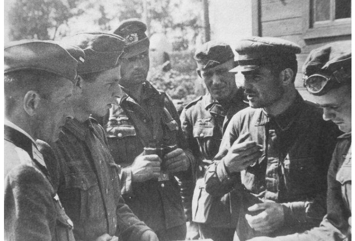
Die Deutschen verhören einen gefangenen sowjetischen Kommissar. August 1941

George: Er war ein seltsamer Kerl. Die meisten waren schreckliche Menschen und noch schlechtere Soldaten. Sie hatten keine Disziplin und wenn sie in Gefängnissen untergebracht waren, benahmten sie sich manchmal wie Tiere, bestahlen sich gegenseitig, kämpften und töteten sogar. Ich habe das 1941 erlebt; ein politischer Offizier befahl die Tötung von Gefangenen, die uns geholfen hatten. Ich weiß, dass er herausgeholt und erschossen wurde und danach durften keine Politoffiziere mehr mit regulären Soldaten zusammen untergebracht werden.