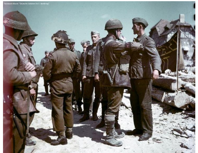
Kanadische Militärpolizisten durchsuchen deutsche Soldaten, die während der Schlacht um die Normandie in Gefangenschaft gerieten. Diese Männer hatten Glück, denn die Kanadier waren dafür bekannt, dass sie sich auf ihrem Vormarsch nur ungern mit Gefangenen belasteten, sondern das Problem mit einer Garbe aus ihrer Maschinenpistole lösten.

Ein wütender, verwirrter Offizier könnte dies angeordnet haben, weil er dachte, die Kanadier würden sich so verhalten. Zu unserer Ehrenrettung sei gesagt, dass zur gleichen Zeit der Befehl erteilt wurde, alle feindlichen Soldaten gefangen zu nehmen, denn wir waren nicht wie unser Feind grausam und sadistisch. Vor Gericht wurden wir alle für nicht haftbar befunden und einige Berichte, die sich mit den kanadischen Befehlen befassen, sind versiegelt. Ich habe nach dem Krieg erfahren, dass sie in der Tat Befehle gaben, keine Gefangenen zu machen. Warum sie das taten, kann ich nur vermuten, aber ich glaube, dass die Propaganda, der sie in England ausgesetzt waren, einen Hass hervorrief, den nur Mord zähmen konnte.