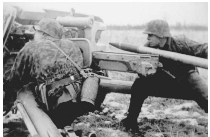
Eine Besatzung der Hitlerjugend 75mm PaK 40 während einer Übung im Jahr 1943. Diese Übung simuliert so genau wie möglich reale Kampfbedingungen mit scharfer Munition. Die Lektionen, die an der Ostfront gelernt wurden, und die Taktiken der russischen Infanterie und Panzer wurden jedem Jugendlichen eingepflegt. Die Ausbildung war zermürbend und aggressiv, aber die Rekruten wurden schon bald zu ausgezeichneten, furchtlosen Kriegerern, was sie zur Kampfelite machte.